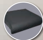
Coussin Classe II