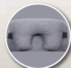
Appareil de soutien partiel de la tête