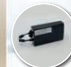
Kit batterie Evasion e II