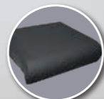
Coussin Classe II