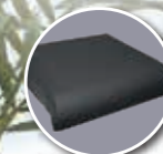
Coussin Classe II