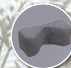
Cale tête fabrication spéciale