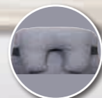
Appareil de soutien partiel de la tête