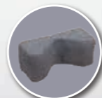
Cale tête fabrication spéciale