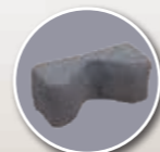
Cale tête fabrication spéciale