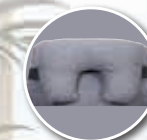
Appareil de soutien partiel de la tête